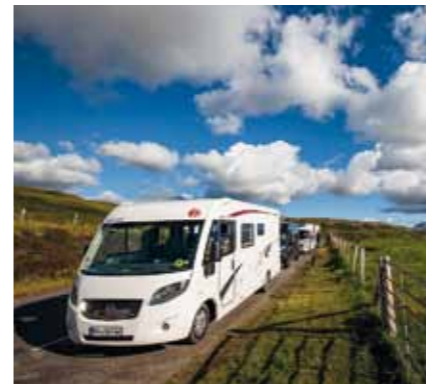
Mit vier Wohnmobilen geht die Reisegruppe der Hundeschule Frei Schnauze auf Schottland-Rundfahrt. Das Wetter ist dafür im September ideal.