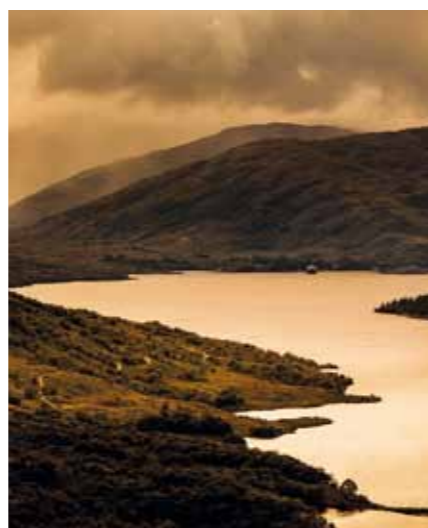
Loch Lomond ist der größte See Schottlands – und gilt auch als der schönste. Er erstreckt sich von Nord nach Süd über 39 Kilometer.

der Hund seinen Menschen im Schlaf riechen kann. Sie sagt: „Für einen Hund ist so eine Campingreise eine sehr intensive Zeit.“