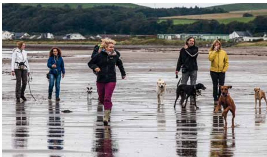
In Schottland können Mensch und Hund an den meisten Stränden ohne Leine toben.