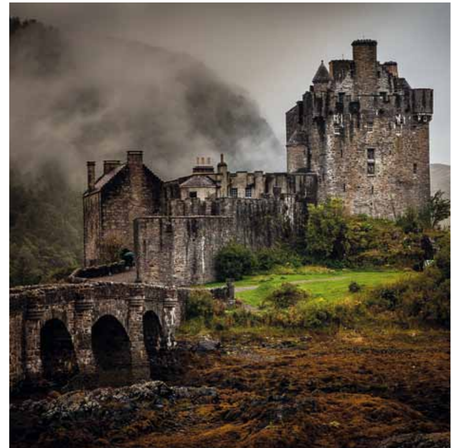
Eilean Donan Castle ist als Kulisse aus den Filmen „Highlander“ und „Braveheart“ bekannt. Bei Flut wird die Burg von Wasser umschlossen.

Tags darauf tolen die Hunde am Strand der Talisker Bay auf Skye herum.